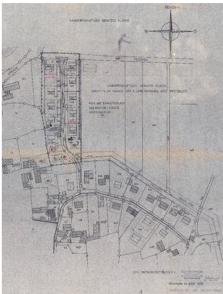
Abbildung 1: Planteil rechtskräftiger Bebauungsplan (Stand: 1983)

Die überbaubaren Bereiche wurden mit Baugrenzen sowie Flächen für Stellplätze oder Garagen festgesetzt.